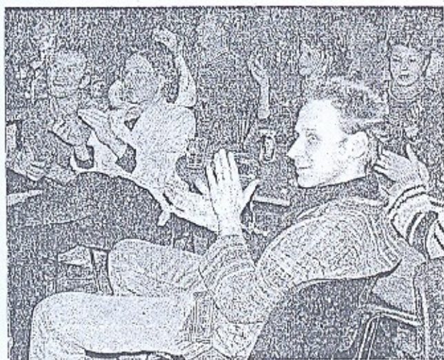
Dès les premiers accords, le public était aux anges.

Reste à souhaiter que maintenant cette Épicerie vienne souvent tenir boutique en Haute-Marne.